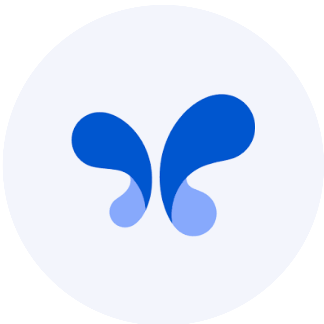
Google AI Studio